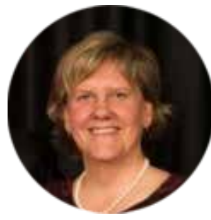
L'honorable Lise S. Parent de la Cour de justice de l'Ontario La médaille Carleton